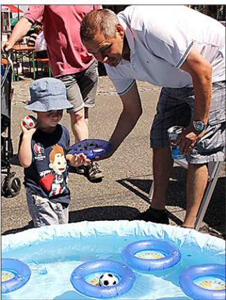
Am Stand von Unicef