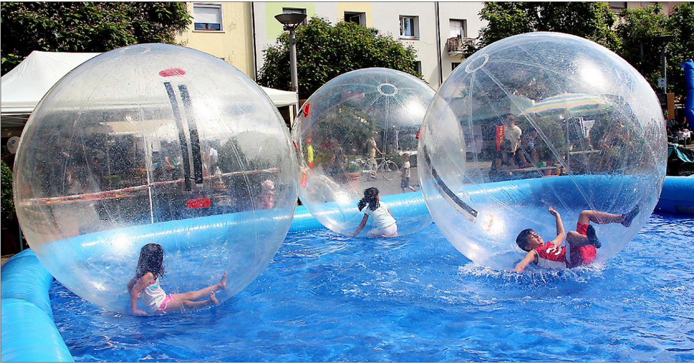
Die DLRG sorgte für viel Spaß im Wasser.