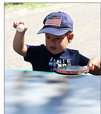
Früh übt sich...

An musikalischer Unterhaltung fehlte es ebensowenig, wobei die Bonds Big-Band unter Leitung von Christian Leitherer bereits zur Eröffnung bestens aufspielte. Tänze und Theater gab es auch. Schüler der Klasse 5d der Realschule machten beispielsweise am Stand der Stadtverwaltung „Kinderfreundliche Kommune“ mit ihrem selbst verfassten Theaterstück deutlich, dass alle Kinder die gleichen Rechte haben müssen.