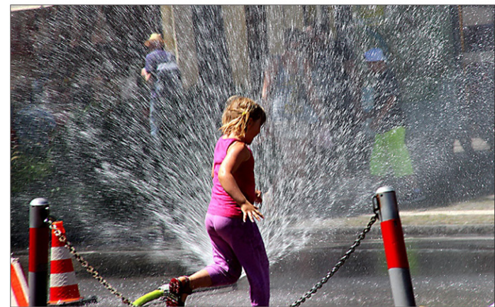
Die Jugendfeuerwehr sorgte für Abkühlung.