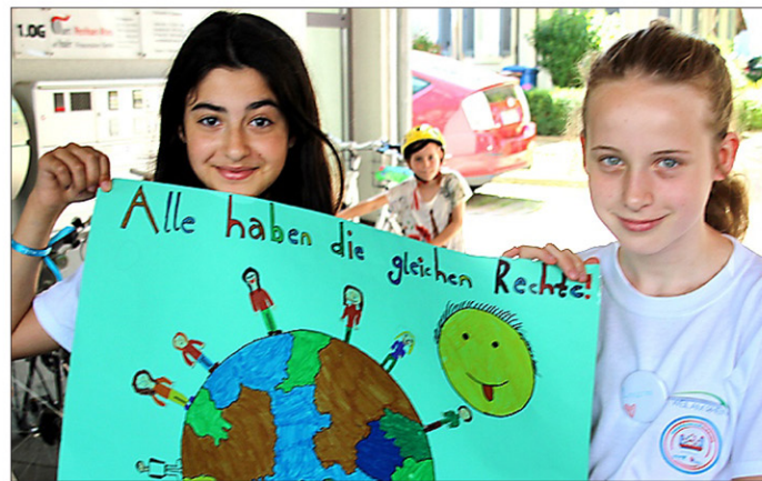
Realschüler der Klasse 5d bei einem Theaterstück